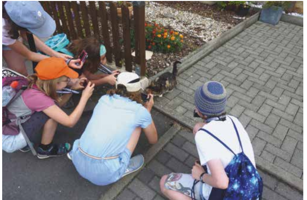
nächste Seite: making off