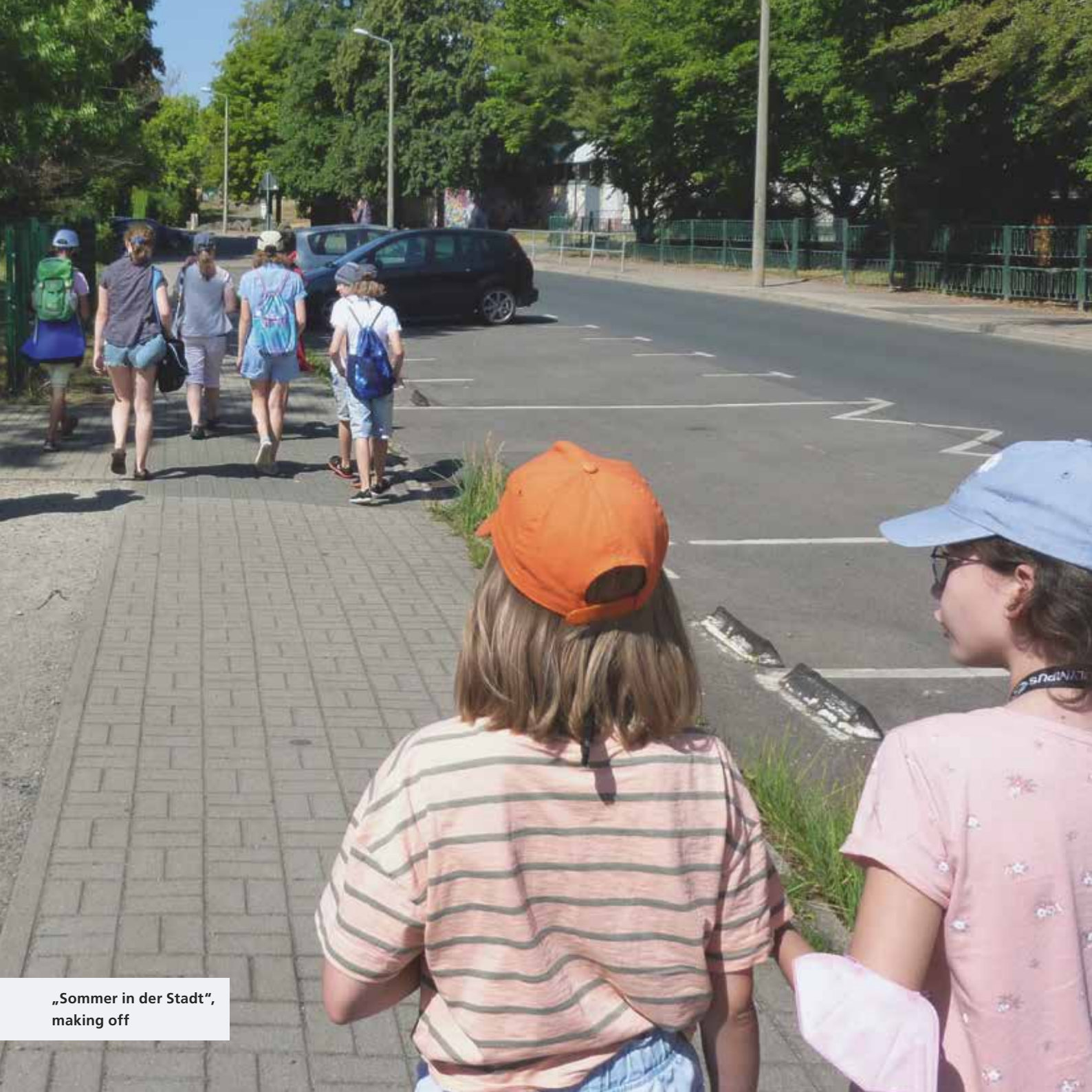
„Sommer in der Stadt“, making off